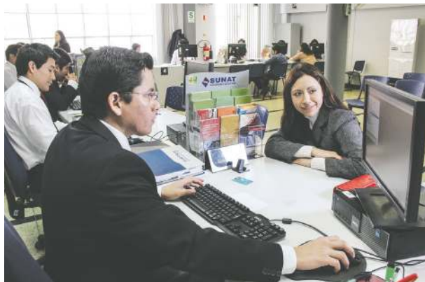
Panorama. Se espera que este año se logren mayores ingresos.