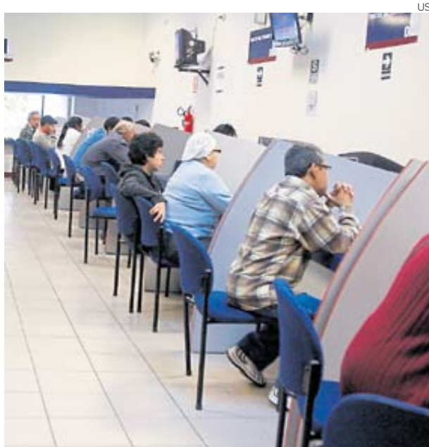
NÚMERO DE AFILIADOS SPP Y SNP