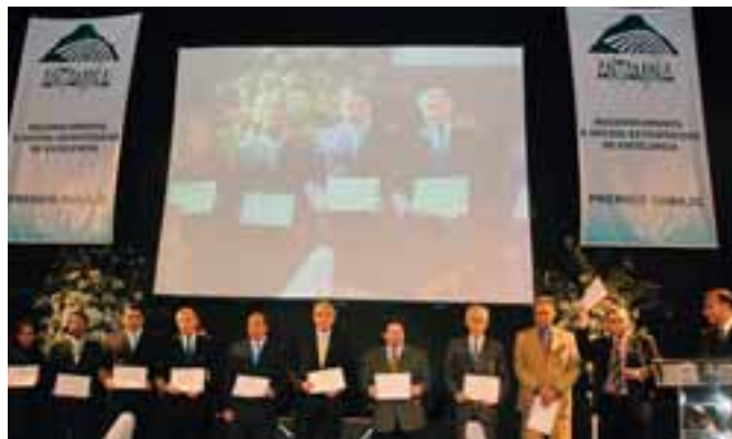
Ceremonia de premiación.

El Premio Sumajg fue instituido por Antamina en el año 2007 con el propósito de reconocer las buenas prácticas de sus socios estratégicos en distintas categorías. Este año se introdujo el Sumajg Universitario, que premia los principales trabajos de investigación en distintas categorías.