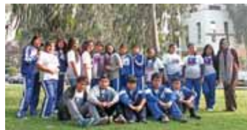
Escolares del colegio Manuel Scorza.