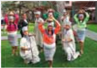
Elenco del taller de danzas folclóricas.

Los talleres artísticos son verdaderos canalizadores del talento juvenil. La Universidad se llenó de música, baile y risas durante la sexta edición del Talent Show , realizado el viernes 14 de diciembre en el campo deportivo como actividad de fin de ciclo. Los asistentes disfrutaron las creativas coreografías de salsa, bachata, chachachá, hip-hop y tango, y vibraron al ritmo de la marinera norteña, el festejo y una contagiante danza de la selva. El taller de canto cautivó al público con sus melodías navideñas. Por último, la cuota de humor la pusieron los alumnos del taller de improvisación, que hicieron reír a la audiencia con sus ocurrentes historias.