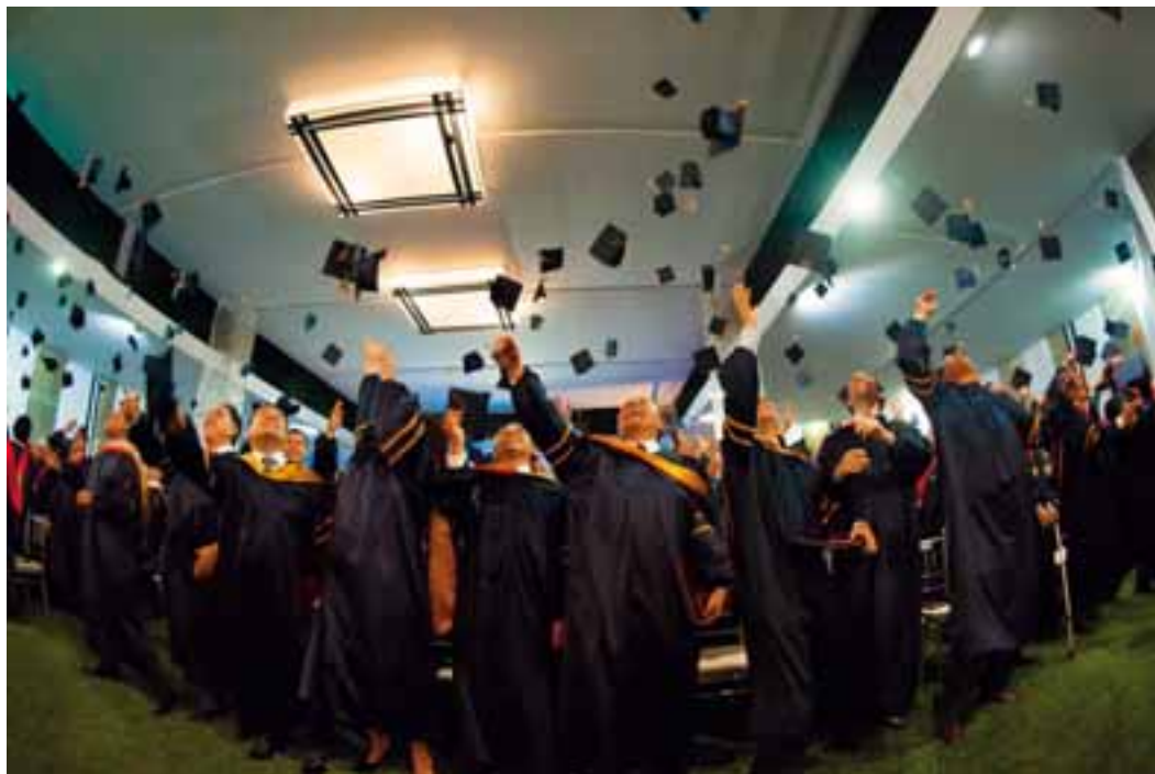
Graduados de las maestrías celebran lanzando sus birretes.

En diciembre, en el jardín central del campus y ante la presencia de familiares y amigos, se realizaron las ceremonias de clausura de nuestras maestrías. El 11 de diciembre se graduaron 187 participantes de la Maestría en Administración, de Lima, y de la Maestría en Dirección de Empresas, programa dictado en otras importantes ciudades del país.