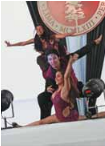
Taller de salsa.