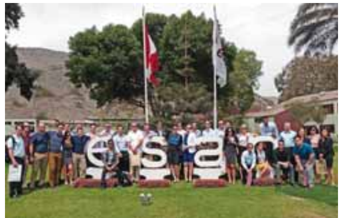
Grupo de alumnos del MBA de Western Ontario, Canadá.