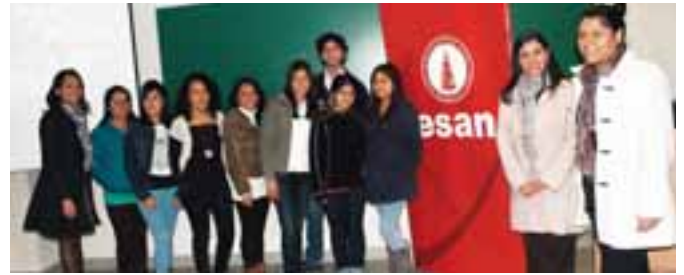
Alumnos encargados de la capacitación a los escolares.

La participación en este tipo de proyectos sociales nace en el marco de las actividades orientadas a la formación de jóvenes líderes empresariales y socialmente responsables. Además de los alumnos, también participan en este proyecto profesores, quienes desarrollan sesiones de orientación sobre ética empresarial, responsabilidad social y gestión de planes de negocios. Por su parte, los universitarios brindan a los escolares asesoría en cursos básicos de administración, finanzas, procesos, conocimiento del mercado, a fin de capacitarlos para que puedan poner en marcha sus ideas de negocios.