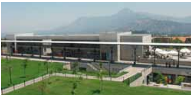
Universidad del Desarrollo.

http://www.enim.fr/portalenim/espanol/index.shtml