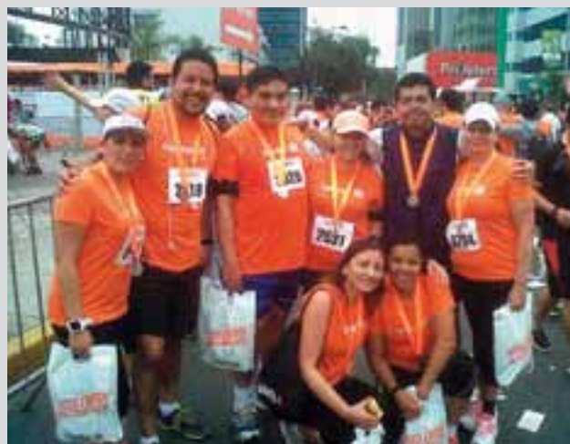
Grupo de trabajadores de ESAN luego de su participación en la Maratón Nextel.

El domingo 25 de noviembre, un grupo de trabajadores de diversas áreas de nuestra universidad participó en la Maratón Nextel 10K, organizada en beneficio de la educación inclusiva, es decir, para hacer posible que la población escolar de bajos recursos reciba servicios educativos de calidad. Nuestros representantes recibieron una medalla de reconocimiento por su contribución al deporte y a esta importante iniciativa. La universidad alienta a sus colaboradores a mantener viva esta valiosa cruzada por los niños del Perú.