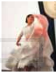
Taller de marinera.