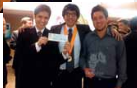
Proyecto l'm HERE.