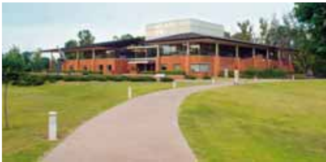
Universidad San Andrés.