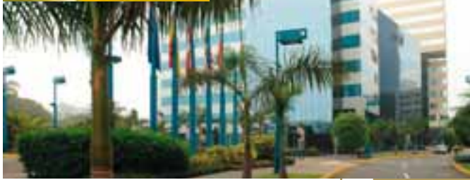
Centro Empresarial y Swissôtel de San Isidro.