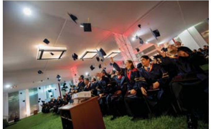
Al término de la ceremonia, los recién graduados del MBA lanzan sus birretes.