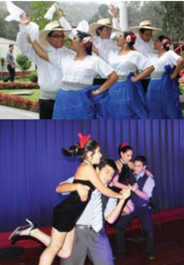
Nuestros alumnos demuestran sus habilidades.