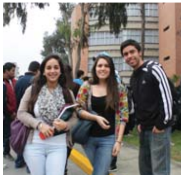
El 16 de agosto se inició el nuevo semestre académico 2012-II.

Nuevos alumnos se sumaron este ciclo a la comunidad académica con ansias de empezar una nueva etapa en sus vidas. Recibieron una charla de inducción sobre lo que significa la vida universitaria.