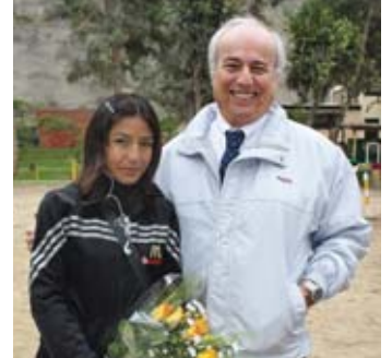
La maratonista Inés Melchor, luego de su destacada participación en los Juegos Olímpicos Londres 2012, visitó nuestro campus para inaugurar la Copa UESAN de Fútbol 2012.