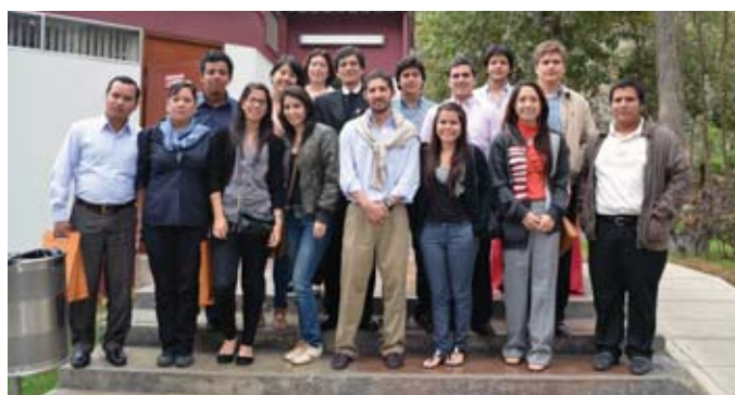
Alumnos de la Universidad Casagrande, Ecuador.