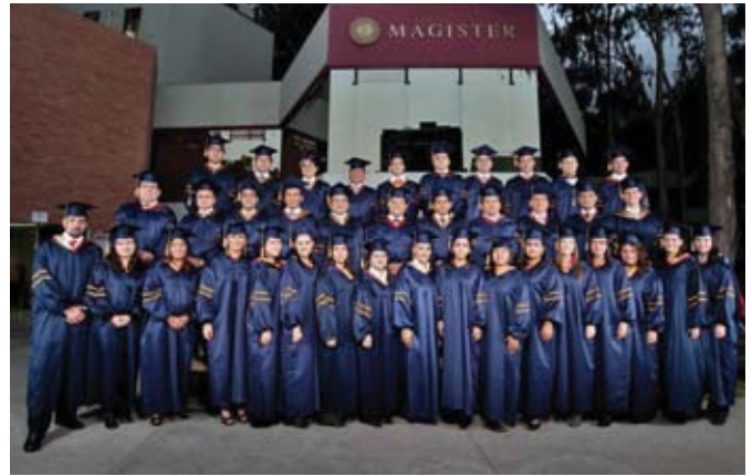
Graduados de la Maestría en Finanzas.