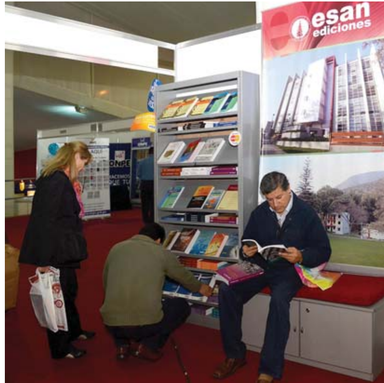
Stand de ESAN Ediciones.