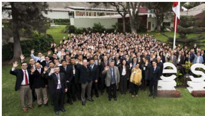
Participantes de la XXV Semana Internacional

“Para lograr la efectividad es necesario que el directivo de hoy sea capaz de gestionar los recursos humanos, es decir, los recursos que tienen las personas, como inteligencia, valores, conciencia y libertad de elegir. Lo primero que el ejecutivo debe hacer es tratar a los trabajadores como personas y no como máquinas, motivándolos, valorando su esfuerzo, generándoles confianza, hablándoles en un lenguaje similar y no distinto, pues de esta manera se pueden lograr grandes proyectos. Además, el directivo debe aportar valor a los grupos de interés: clientes, proveedores, trabajadores, accionistas y la sociedad en general. La idea es que los grupos de interés sientan que ganan algo con la empresa, así esta sobrevivirá”.