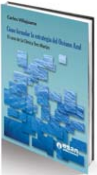
Cómo formular la estrategia del océano azul Carlos Villajuana