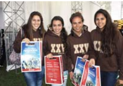
Alumnas del Colegio Casuarinas.