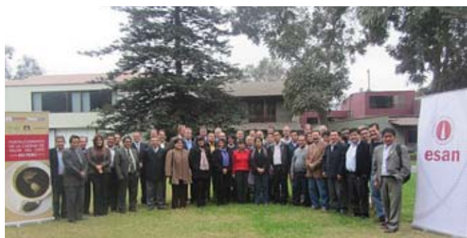
Participantes del taller para el sector cafetalero.

El evento fue organizado en alianza con el Minag, ACDI/VOCA (institución internacional sin fines de lucro), la Junta Nacional del Café, la Cámara Peruana del Café y Cacao, Usaid-Perú y otras entidades del sector.