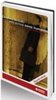
Después de todo, sólo somos seres humanos Luis Felipe Calderón