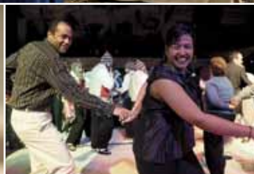
Las noches sirvieron para compartir y disfrutar de nuestra música con los invitados.