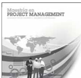
Maestría en Project Management Inicio: 3 de diciembre