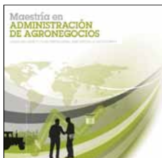
Maestría en Agronegocios Inicio: 27 de noviembre