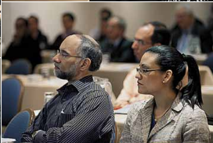
El REE LA 2010 reunió en Lima a representantes de tres continentes.