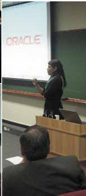
Expositora de Oracle explicando las ventajas del convenio.

Oracle Corporation es una empresa multinacional estadounidense de tecnología informática que se especializa en el desarrollo y la comercialización de productos de software para empresas, en particular sistemas de gestión de base de datos.