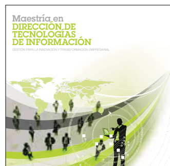
Maestría en Dirección de Tecnologías de la Información Inicio: 1 de diciembre