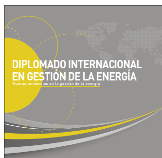
Diplomado en Gestión de la Energía Inicio: 22 de noviembre