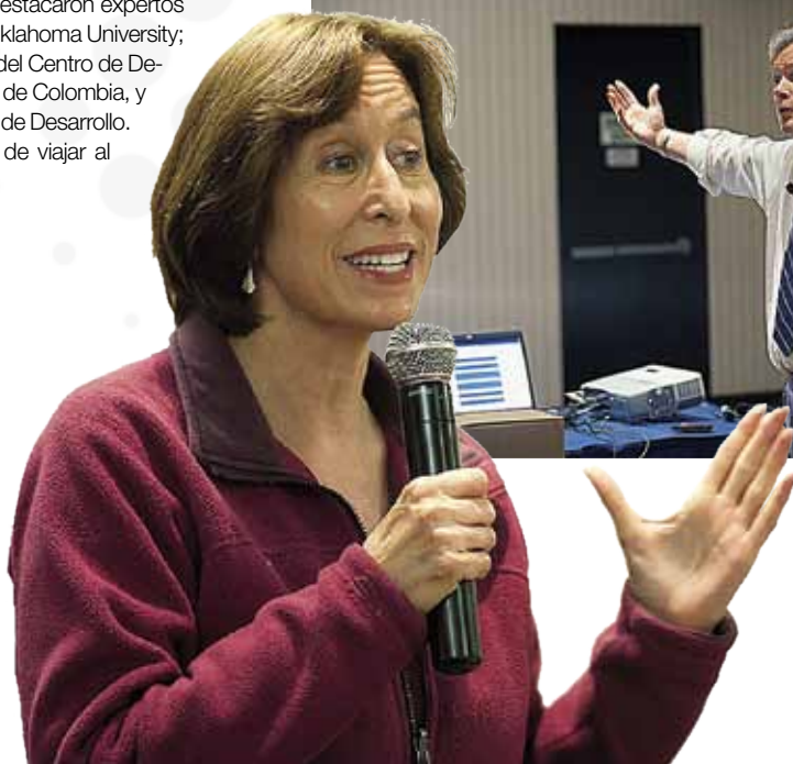
Compartiendo experiencias entre los participantes.