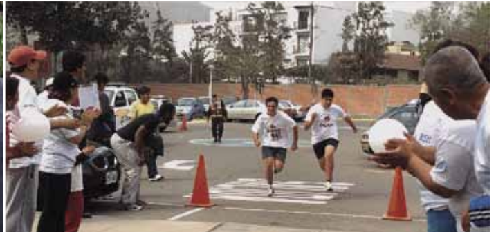
Alumnos de pregrado a punto de cruzar la meta.