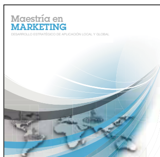
Maestría en Marketing Inauguración: 18 de noviembre