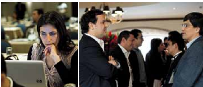
Generando redes entre los asistentes al evento.