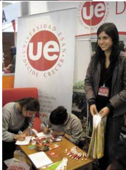
Alumnos de pregrado en el stand de la Universidad ESAN de la Feria.

La Universidad ESAN participó en la VI Feria Educativa Internacional (FEI), realizada del 22 al 23 de setiembre en el Swissôtel de San Isidro. La FEI reúne anualmente a más de 60 universidades locales y extranjeras, que brindan información sobre sus programas de pregrado, posgrado, investigación y perfeccionamiento. A esta sexta edición asistieron cinco mil personas, entre escolares y padres de familia. La Universidad ESAN fue una de las instituciones seleccionadas para ofrecer una conferencia a los asistentes, la cual se llevó a cabo el día 23 y trató sobre las ventajas diferenciadoras de nuestra universidad, así como las oportunidades que ofrece dentro de un entorno globalizado.