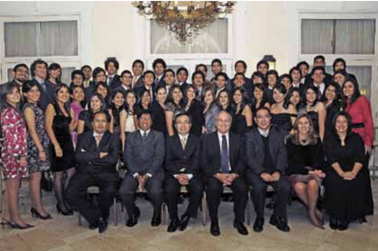
Autoridades de la Universidad ESAN con los alumnos agasajados.