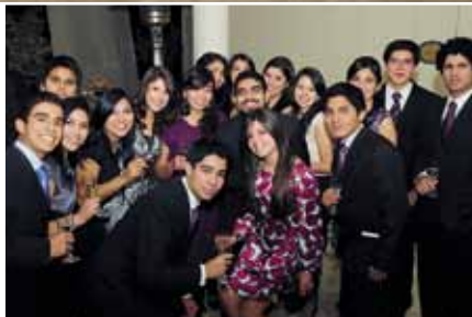
La primera promoción del Pregrado de la Universidad ESAN.