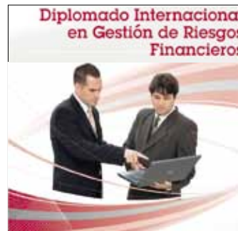
Diplomado Internacional de Gestión de Riesgos Financieros Inicio: 15 de abril