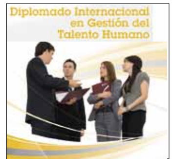
Diplomado Internacional de Gestión de Talento Humano Inicio: 29 de abril