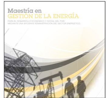
MSc en Gestión de la Energía Inicio: 16 de marzo