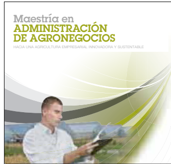
MSc en Administración de Agronegocios Inicio: 10 de abril