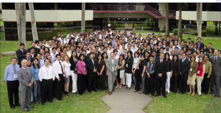
Grupo de participantes de la XX Semana Internacional

"Creo que lo aprendido durante esta estadía me permitió ver al Perú como un país en crecimiento y con mucha expectativa para la inversión. Los profesores son excelentes ya que no están limitados a la región, sino que poseen una amplia perspectiva global".