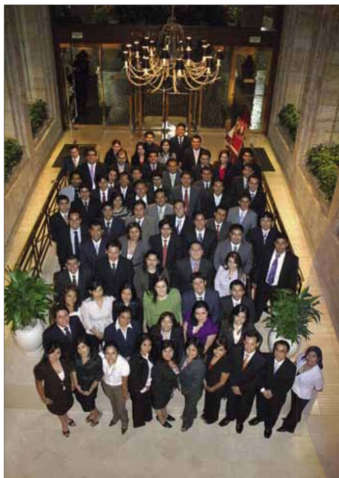
Nuevos alumnos en la comida de inauguración.

Asimismo, el sólido componente internacional de nuestro MBA brinda a estos estudiantes la posibilidad de optar por programas de doble grado e intercambios estudiantiles con más de 70 prestigiosas instituciones de todo el mundo.