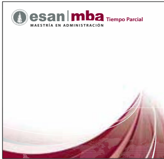
MBA Regiones Huancayo: 19 de marzo Trujillo: 16 de abril