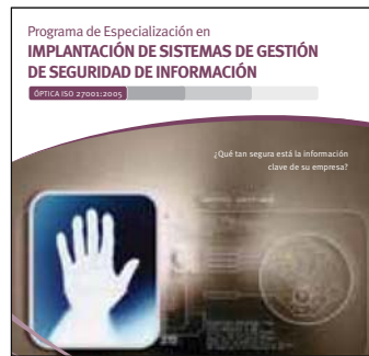
Programa Gestión de Sistemas de Seguridad de Información ISO 27001 Inicio: 5 de abril