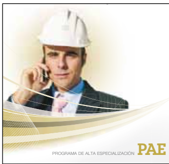
PAE en Gestión Minera Inicio: 18 de marzo