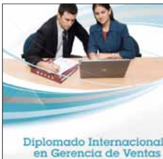
Diplomado Internacional de Gestión de Ventas Inicio: 22 de abril