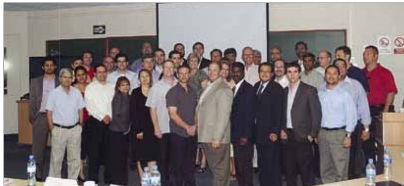
Grupo de estudiantes con Pedro Pablo Kuczynski.