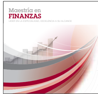
MSc en Finanzas Inicio: 12 de abril