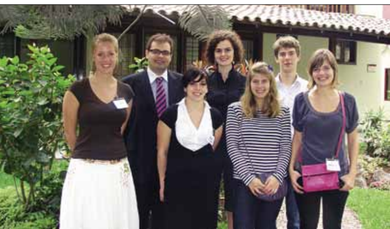
Grupo de estudiantes de intercambio.