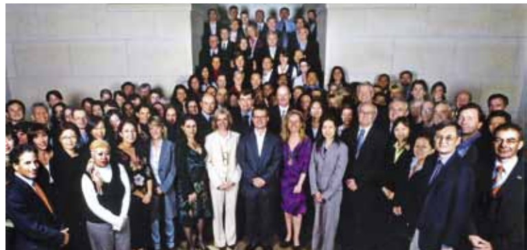
Miembros del PIM en UT-Austin.